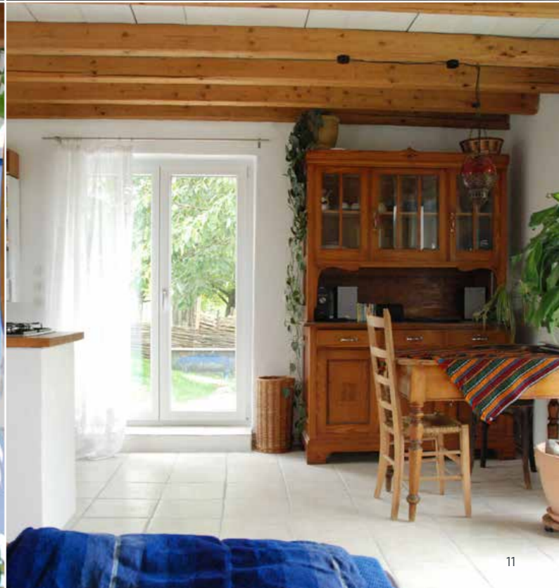
HÜHNERSTALL ZUM WOHNHAUS DEUTSCHLAND, JAHR 2011