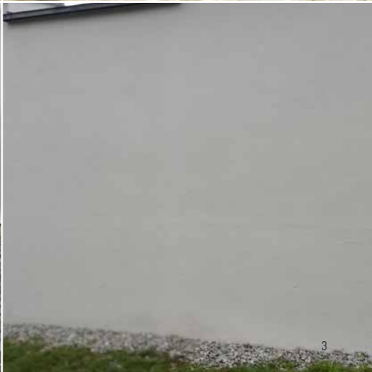
FRIEDHOFSMAUER TITTMONING DEUTSCHLAND, JAHR 2019