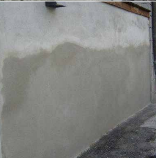
STADT-/KLOSTERMAUER FÜGEN, ÖSTERREICH, JAHR 2006