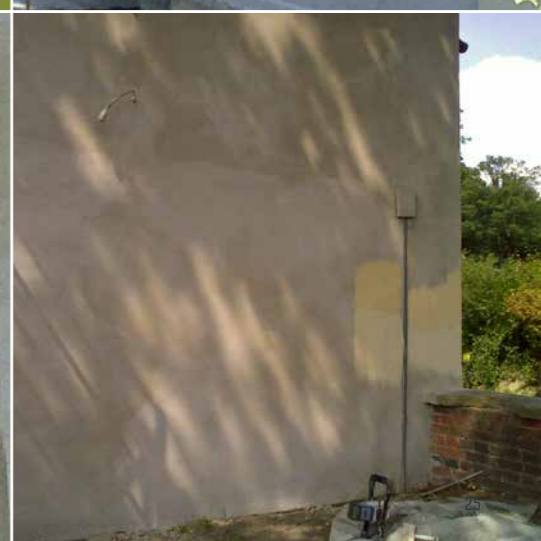
WASSERSCHLOSS ENNIGERLOH DEUTSCHLAND, JAHR 2008