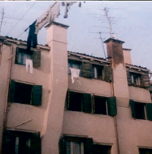
HOTEL CAVALETTO Venedig ITALIEN, JAHR 1984