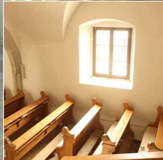
KATH. KIRCHE ALTENBERG ÖSTERREICH, JAHR 2006