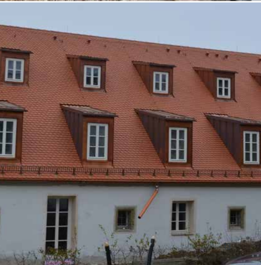
LAGERHAUS ZU BÜROHAUS REGENSBURG DEUTSCHLAND, JAHR 2016