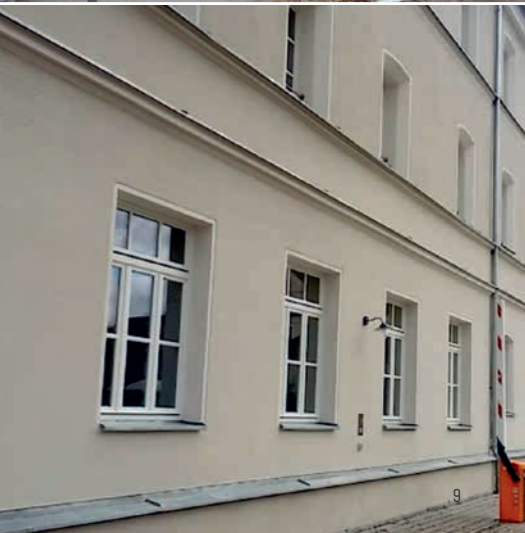
KLOSTER SANKT KLARA DEUTSCHLAND, JAHR 2013