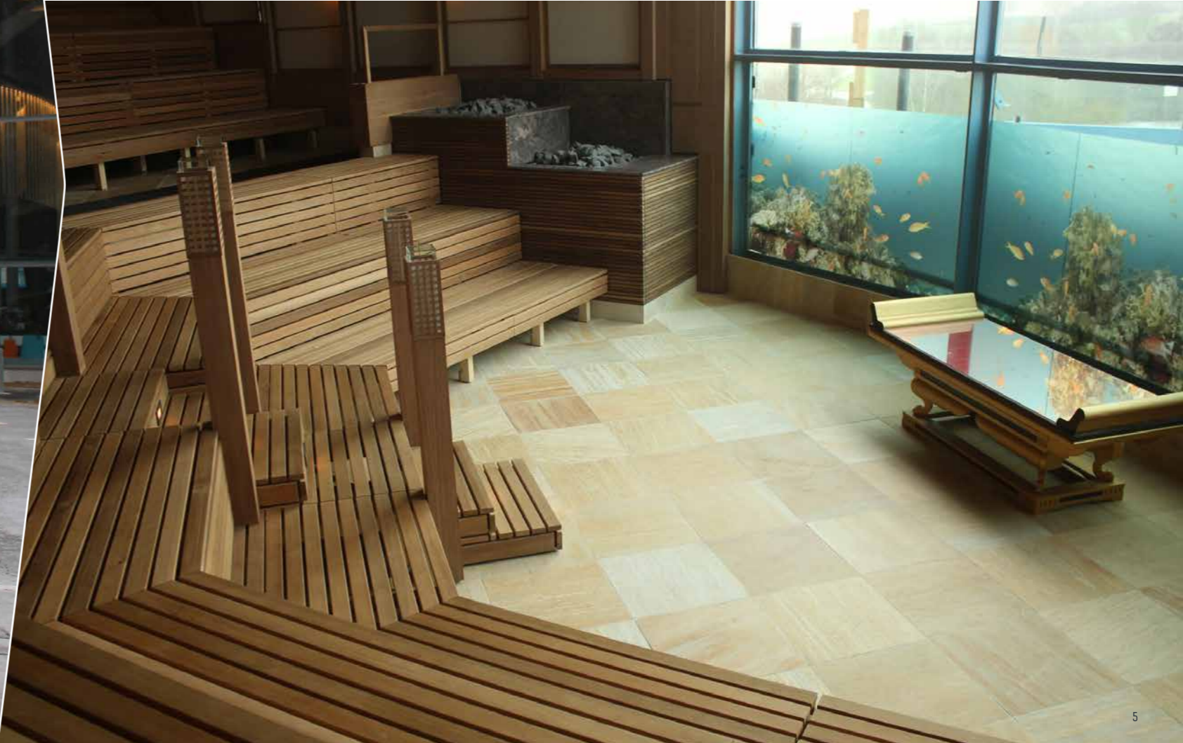
THERMEN & BADEWELT SINSHEIM DEUTSCHLAND, JAHR 2012